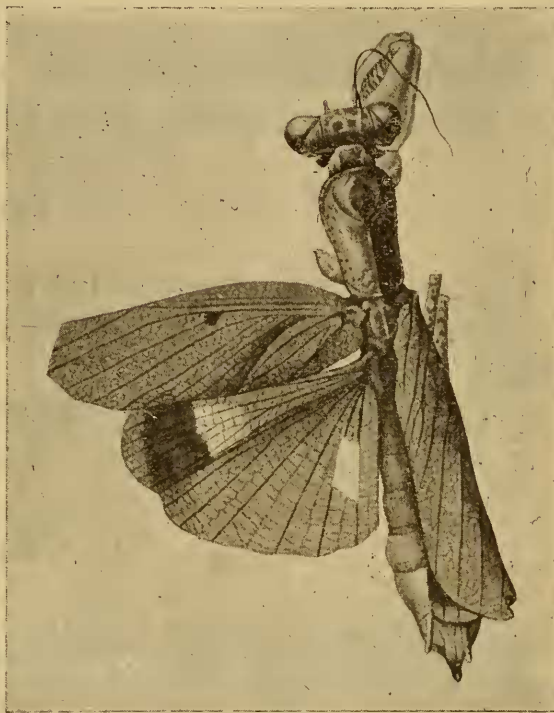
Fig. 1. Compsomantis robusta n. sp. ♀, doppelte nat. Gr.

Caput magnum, crassum, parum altius quam latius, vertice rotundato, scutello faciali multo latiore quam altiore, margine superiore convexo. Pronotum ovale, laeve, lateribus denticulatis, pone sulcum transversum obtuse carinatum. Elytra apicem abdominis haud attingentia, opaca, apice late rotundata, elongata. Coxae anticae remote spinulosae. Metatarsus anticus tarsis omnibus unitis longior.